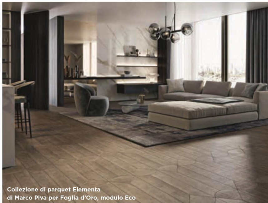
Collezione di parquet Elementa di Marco Piva per Foglia d'Oro, modulo Eco

e dà vita a diverse possibilità compositive, a loro volta interpretabili con contrasti materici o cromatici. Le superfici possono comporre diversi disegni, sia impiegando finiture di legno diverse, sia accostando metalli e marmi, che rendono le doghe personalizzabili pressoché all'infinito, dunque