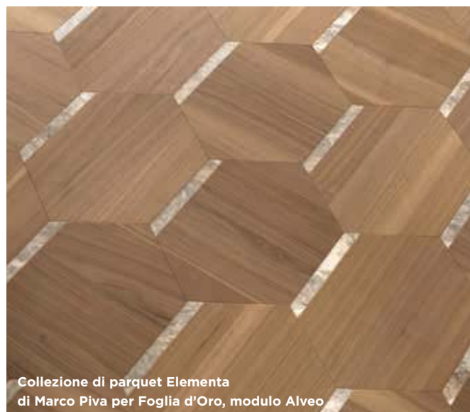
Collezione di parquet Elementa di Marco Piva per Foglia d'Oro, modulo Alveo

I pavimenti della collezione Elementa , progettata da Marco Piva per Foglie d'Oro , sono pavimenti modulari in legno , che uniscono il lusso alla sostenibilità. I sei differenti pavimenti sono formati da elementi modulari che si possono integrare tra loro, scambiando disegni e misure, per superfici sempre diverse. In legno o rovere, di provenienza certificata da foreste europee gestite in modo sostenibile, le doghe della serie Elementa hanno pattern che creano diversi motivi decorativi, interpretando in modo creativo venature e peculiarità del legno. Eco, Ritma, Zago, Unda, Alveo, Regolo sono i sei diversi moduli; ogni modulo evoca suggestioni in cui si incontrano natura e progetto