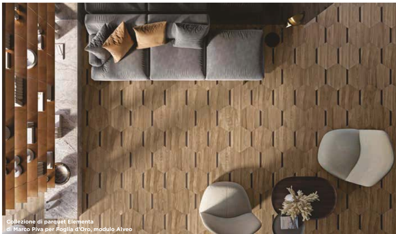
Collezione di parquet Elementa di Marco Piva per Foglia d'Oro, modulo Alveo

abbondanza di disegni, decori e colori per pavimenti e pareti, con cui progettare interni sempre più personalizzati e completi. E sempre più sostenibili. Tra legni e laminati certificati, infatti, i materiali sono sempre più riciclati, riciclabili, a base naturale, con finiture senza solventi.